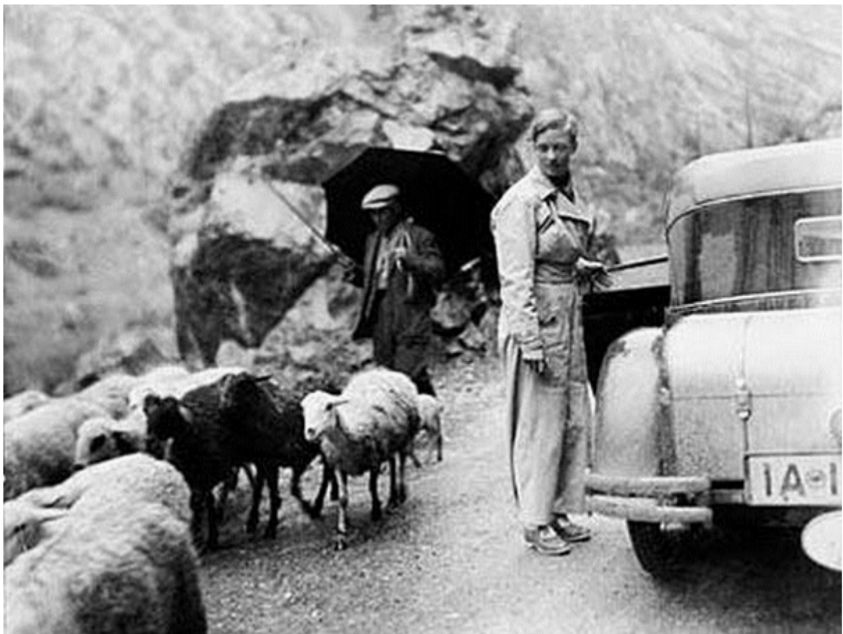
Annemarie Schwarzenbach avec sa Mercedes Mannheim, dans les Pyrénées espagnoles, mai 1933